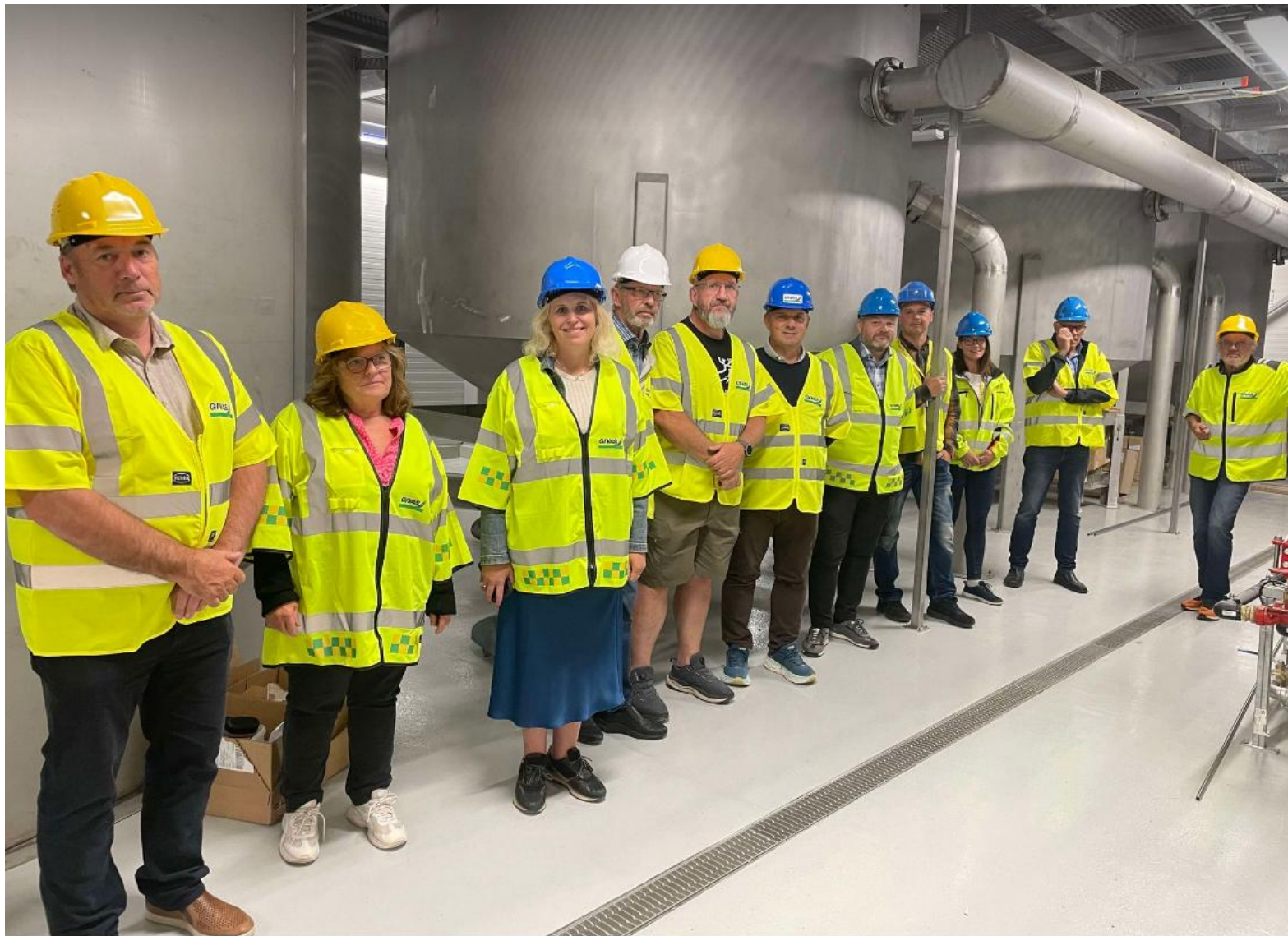
Befaring Eidskog kommune formannskap 21.8.24